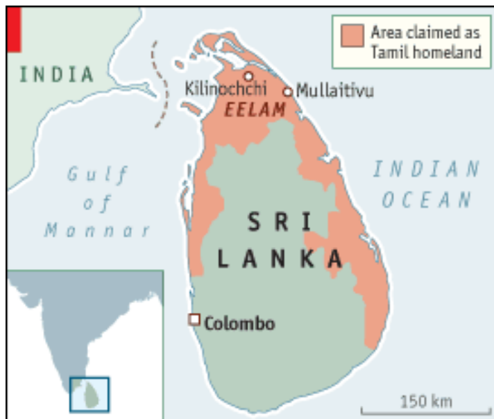
Figur 2. Området som de tamilska tigrarna (LTTE) strider för att upprätta den självständiga staten Eelam på.

Konflikten på Sri Lanka är en konflikt mellan de etniska grupperna singaleser och tamiler. Singaleserna utgör majoriteten och dominerar styret i landet. Tamilerna utgör en minoritet i främst de östra och norra delarna av landet. Den tamilska befolkningen har ända sedan självständigheten från Storbritannien 1948 då Ceylon bildades behandlats diskriminerande av den singalesiska regeringen. 1972 byttes namnet från Ceylon till Sri Lanka och då infördes också en ny konstitution som missgynnade tamilerna ytterligare. 50 Under samma år bildades Tamil New Tigers som en motståndsrörelse mot regeringens diskriminering. 1976 ombildades organisationen till de Liberation Tamil Tigers of Eelam (LTTE) eller de tamilska tigrarna . Eelam är den tamilska benämningen på den stat de kämpar för att upprätta.