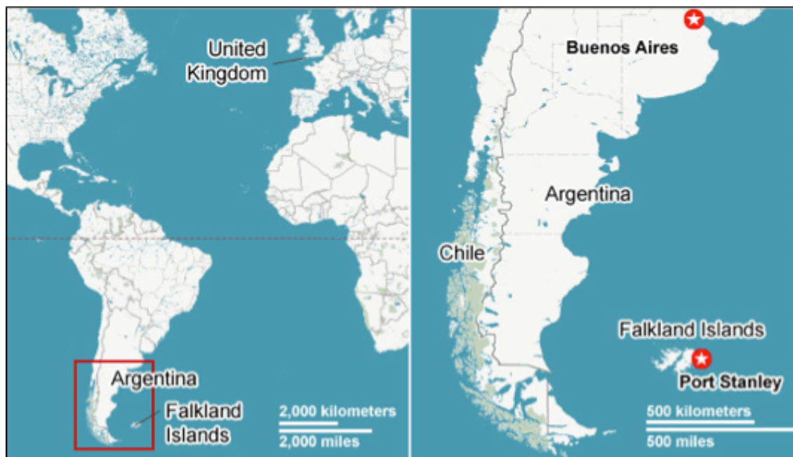
Figur 4. Falklandsöarnas geografiska belägenhet i förhållande till Argentina och Storbritannien. 50

Falklandsöarna består i huvudsak av två större öar; East Falkland (6682 km 2 ) och West Falkland (5278 km 2 ). Till detta kommer cirka 780 mindre öar runt omkring. Ögruppen är belägen i Sydatlanten cirka 400 km österut från Argentinas fastland. Till ögruppen hör även öarna South Georgia och South Sandwich Islands vilka befinner sig 1 300 km och 2 100 km österut från Argentinas fastland. 49