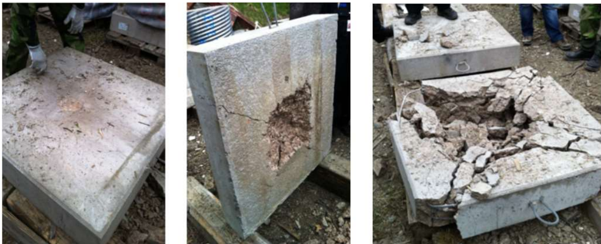
Bild 4: Bilder från en sprängning av betongplattor med ett civilt sprängämne och med sprängdeg (friliggande laddningar). Bilderna påvisar skillnaden i stötverkan från två sprängämnen med samma laddningsvikt. Bilden till vänster visar effekten på ovansidan av betongplattan (där laddningen var placerad) från det civila sprängämnet. Bilden i mitten

Alla civila sprängämnen, förutom PENO C, hade en lägre stötverkan än sprängdeg. Stötverkan låg mellan 16 och 107 procent av sprängdegens stötverkan, där de flesta civila sprängämnen låg under 50 procent. Sprängdeg ses även i det här fallet som tillräcklig bra stötverkan för att uppfylla uppdraget friliggande laddning. De flesta civila sprängämnen kommer inte i närheten av stötverkan för sprängdeg vilka därför bedöms att inte uppfylla uppdraget som friliggande laddning. PENO C bedöms som tidigare nämnt lämplig för både friliggande och innesluten laddning.