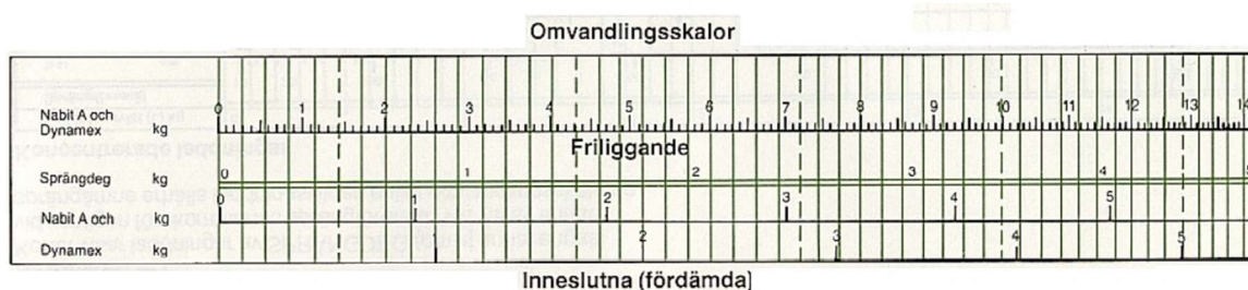
Bild 3: Omvandlingstabell för laddningsberäkningar ur fältarbetsreglemente sprängning. 55

Friliggande laddningar placeras friliggande mot, objektet som ska sprängas, sida. En friliggande laddning kan var koncentrerad eller långsträckt beroende på hur objektet som ska sprängas form. Vid sprängning av hårda objekt, som stål eller betong, placeras den friliggande laddningen med största möjliga kontaktyta mot objektet. 54