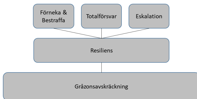
Figur 4. Utvecklat ramverk för gråzonsavskräckning.

Med ovanstående resonemang om denna studies resultat tillsammans med den nyligen publicerade forskningen om resiliens som avskräckning föreslås en utveckling och komplettering av Takahashis teori om gråzonsavskräckning. Utvecklingen består av att teorins tre delar, förneka och bestraffa, totalförvar och eskalation, kompletteras med ett fjärde element bestående av en bas av resiliens, enligt figuren nedan.