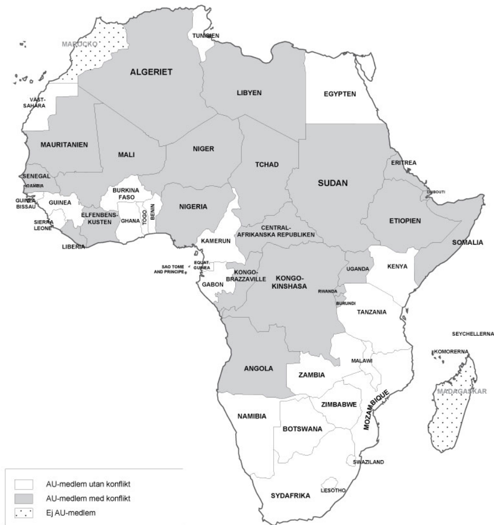
KARTA 1. AU-länder och förekomst av konflikter juli 2002 till och med december 2011

Mellan juli 2002, då AU blev aktivt, fram till december 2011 uppstod 113 konfliktsituationer hos dess medlemmar då ett flertal parter (varav minst en var en stat) använde militär maktutövning. Dessa konfliktsituationer har jag slagit samman i mer övergripande konflikter vilket har resulterat i 21 konflikter, varav en kan klassas som mellanstatlig (mellan Djibouti och Eritrea) och övriga 20 klassas som inomstatliga konflikter.