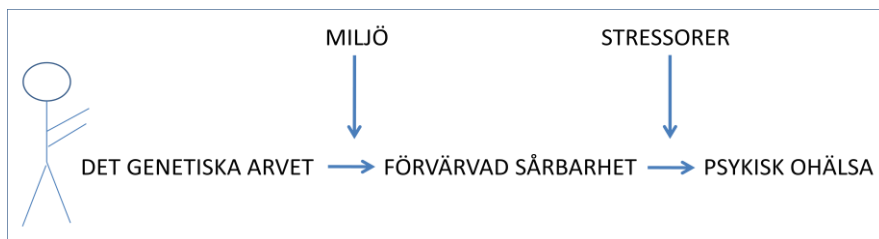
Bild 1 Schematisk bild över stress- och sårbarhetsmodellen

Modellen utgår från att varje individ har olika genetiska eller förvärvade förutsättningar av att klara av stress, s.k. sårbarhet. Kombinationen av den medfödda eller förvärvade sårbarheten styr således stresståligheten hos individen. Två individer klarar alltså samma påfrestning olika bra, som t.ex. stress förorsakat av traumatiska händelser i insats eller stress att inte kunna ha omvårdnad av anhöriga vid lång frånvaro från familjen.