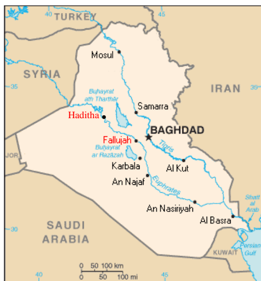
Figur 2 . Irak med städerna Haditha och Fallujah

I följande två avsnitt kommer läsaren först få en beskrivning av den utvalda COIN operationen. Därefter sker en återkoppling mot de kvarvarande strategiska målsättningarna. Slutligen genomförs en analys av operationen med hjälp av kriterierna som används för att påvisa förekomst av effektbaserat tankesätt.