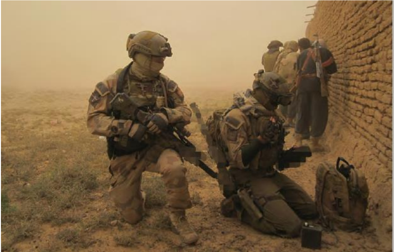
Bild 2. Operatörer ur Folder 95

Utifrån bilden ser författaren i förgrunden två beväpnade individer i uniform. Nationstecken saknas varpå nationstillhörigheten bedöms svår att etablera. Individernas ansikten är täckta varpå igenkänning blir nästintill omöjligt. Det som går att urskilja är att de bär utrustning som inte är standard inom FM. De har annorlunda hjälmar, annan uniformsjacka och till synes andra eldhandvapen. Vapnen är avsiktligt retuscherade varpå igenkänningen blir svår.