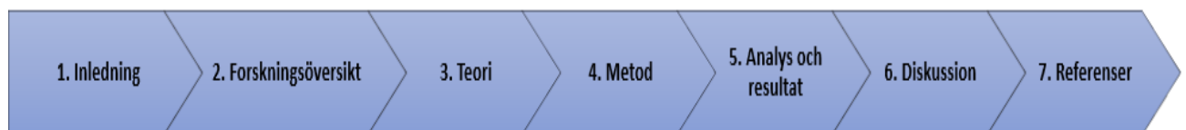
Figur 1. Studiens disposition.

Figuren nedan visar uppsatsens disposition och kapitelindelning. Respektive kapitel består av underrubriker och inleds med en beskrivning avseende innehåll och syfte.