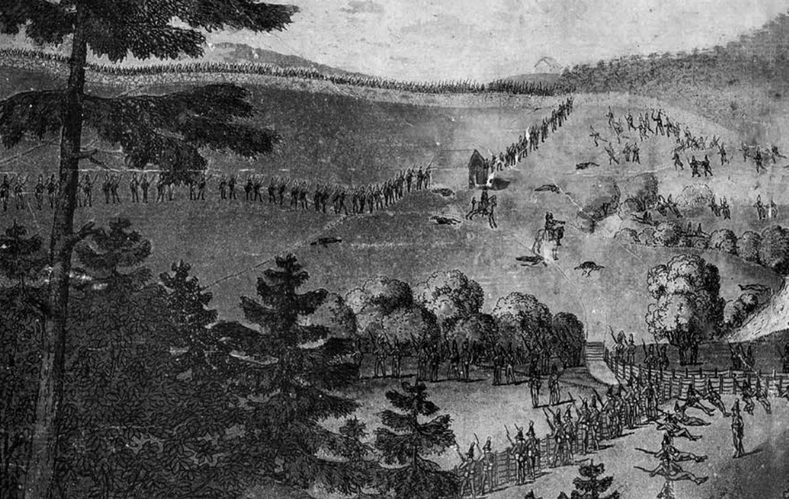
Träffningen vid Berby i Enningdalen i Norge, den 12 september 1808 (detalj). Längs åskammen överst i bilden syns en sluten svensk infanteribataljon och framför bataljonens front har en jägarkedja grupperats (i mitten av bilden). Nere till höger i bild syns den norska ställningen vid Berby gård. Handkolorerad akvatint av Niels Truslew (Østfoldmuseene – Halden historiske Samlinger).

med hela bataljonen eller delar av den. 136 Detta inkluderade både den indelta Kronobergsbataljonen, Västmanlands vargering 137 och Livregementet till fot. Av särskilt intresse är att den rimligen rätt oövade vargeringsbataljonen både anges ha varit kapabel att operera i kedja och växla till sluten formation under den intensiva strid som utvecklade sig. I Lagerbjelkes journal omnämns också ”Upplands jägarkompani” ha deltagit i striderna. 138 Eftersom de enda upplandsförbanden som närvarade var vargeringsbataljoner, torde alltså regementsjägare ha organiserats även i dessa förband.